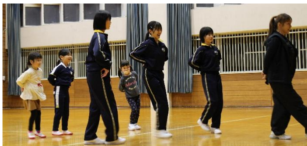
《 キッズダンス 》