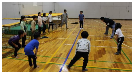
《 トランポリン 》