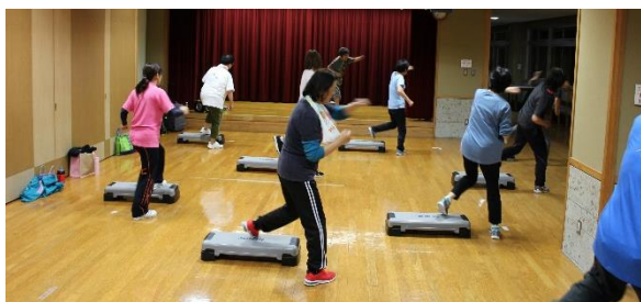
《 完全燃焼！フィットネス 》